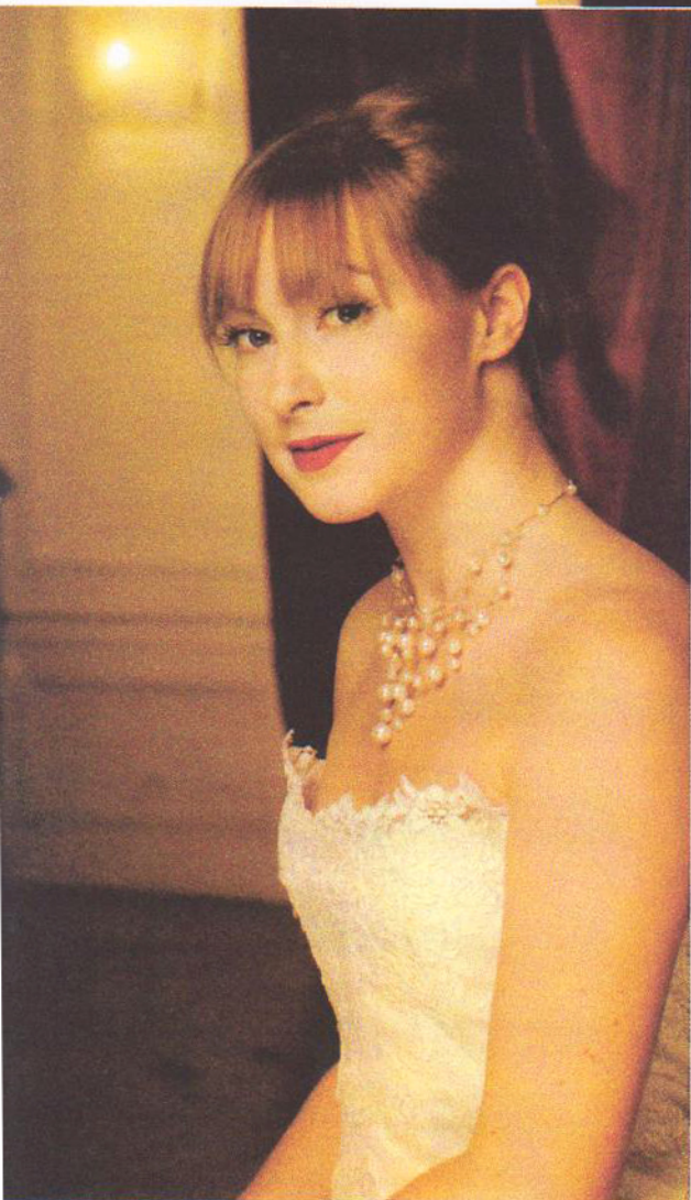
→ CYMBELINE - ALADIN